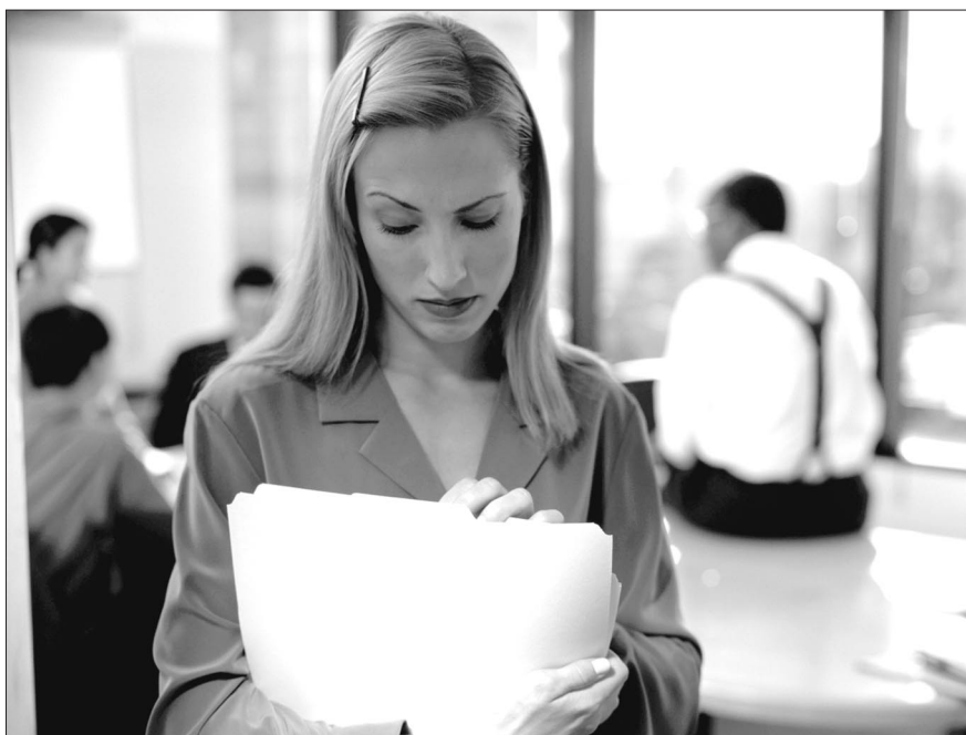
Wer andere Ansprüche an sein Arbeitsumfeld hat als die Kollegen, läuft Gefahr, von ihnen isoliert oder sogar gemobbt zu werden.